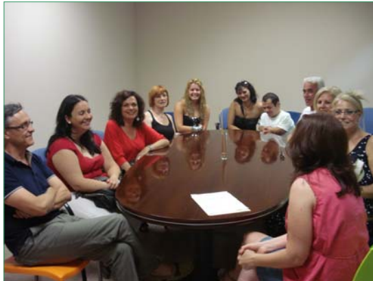
Más del 50% de la Plantilla de Verdiblanca acudió a las votaciones realizadas en el vestíbulo de la sede de Verdiblanca, donde se habilitó una urna que dio los nombres del nuevo Comité.